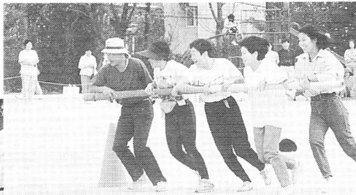
▲ 地区対抗、台風の日競技